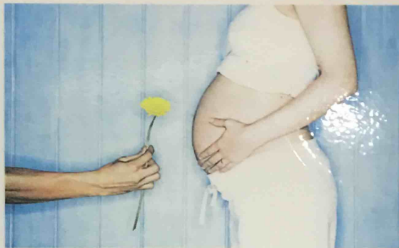
一對夫婦在沒有懷孕的情況下生活一年而沒受孕，已可稱為不育。