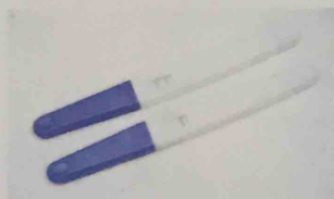
女士可透過排卵棒驗小便檢驗是否有排卵。